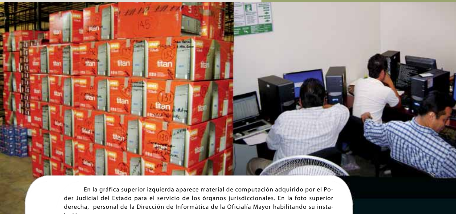
En la gráfica superior izquierda aparece material de computación adquirido por el Poder Judicial del Estado para el servicio de los órganos jurisdiccionales. En la foto superior derecha, personal de la Dirección de Informática de la Oficialía Mayor habilitando su instalación.