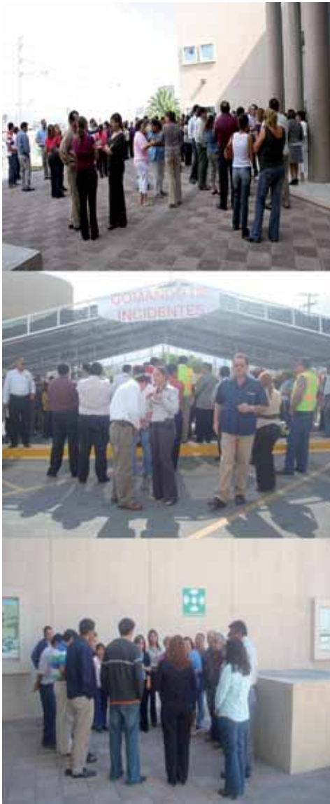
En la gráfica se pueden apreciar diversos aspectos de las acciones preventivas promovidas por la Oficialía Mayor para la capacitación en la prevención de accidentes.

diferentes órganos y dependencias, por lo que a través de la Oficialía Mayor, se gestionaron ante la autoridad experta en la materia, pláticas preventivas sobre este virus, se instalaron también filtros generales de acceso a los edificios, se estableció un protocolo para la limpieza de las instalaciones cada 4 horas, dotando para ese efecto a la totalidad de los órganos y dependencias de paquetes especiales que contenían el material indicado para llevar a cabo dicha tarea.