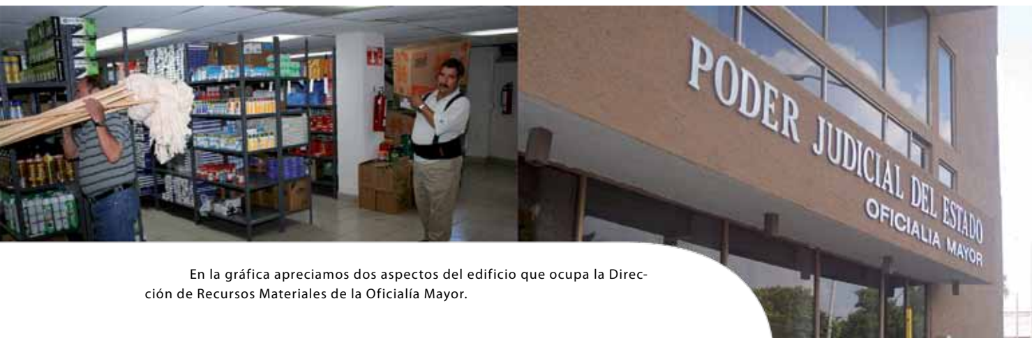
En la gráfica apreciamos dos aspectos del edificio que ocupa la Dirección de Recursos Materiales de la Oficialía Mayor.

tos órganos jurisdiccionales y administrativos la oficialía mayor ha gestionado cursos y capacitaciones con las dependencias especializadas en los métodos preventivos para brindar mayor conocimiento en la prevención de accidentes dentro de las instalaciones.